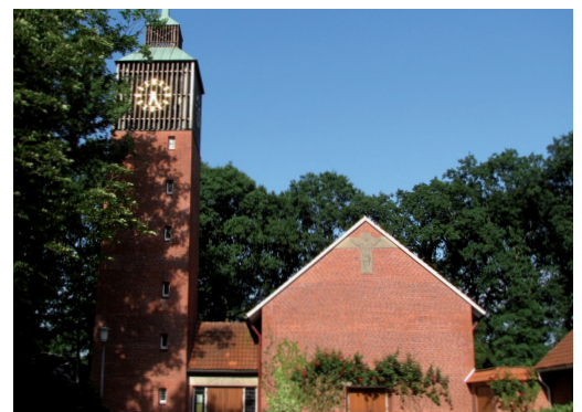
St. Petri Mulsum & Martin-Luther Fredenbeck